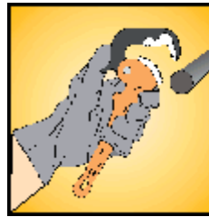
Ouvrir en appuyant la gâchette