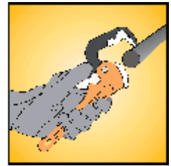
Enlevez la clef en poussant la gâchette et en ouvrant les mâchoires de