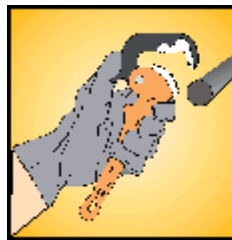
Apertura presionando la pestaña superior