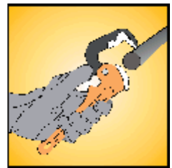
Libere la llave presionando sobre la pestaña y abriendo la mordaza superior